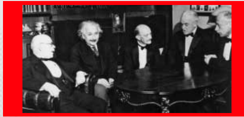
Albert Einstein im Kreise weiterer Nobelpreisträger: Walther Nernst, Max Planck, Robert Andrews Millikan bei Max von Laue.

1921 Physik-Nobelpreis für die Arbeiten zum Photoelektrischen Effekt